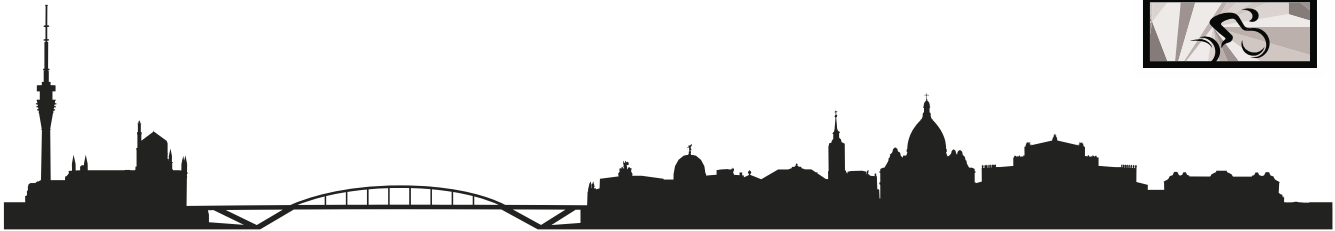
Streckenplan - Plan of the course - Jedermannrennen 58 km Stadtrunde Dresden - Dresden